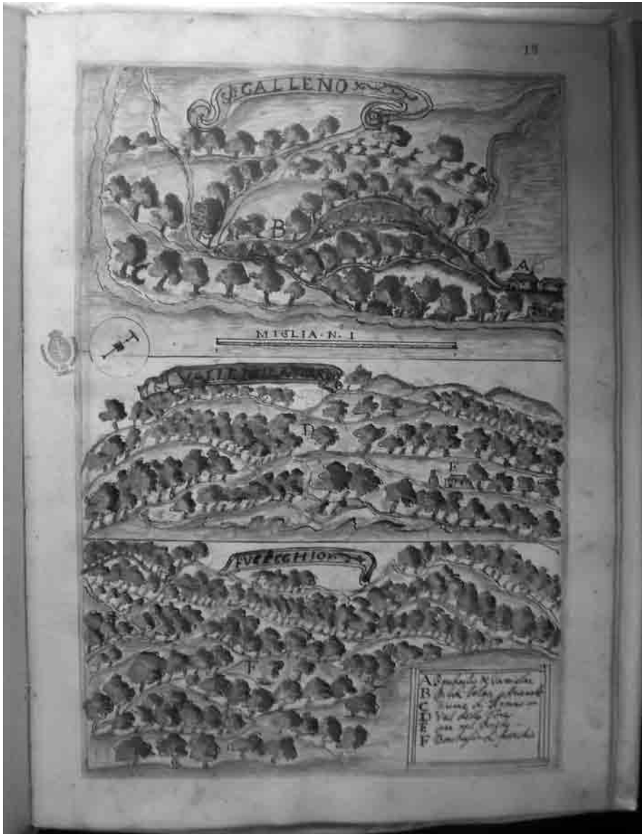
Figura 3. I boschi di Galleno e Fucecchio (Fucecchio) e quello di Valle della Torre (Castelfranco di Sotto) (c. 18r)