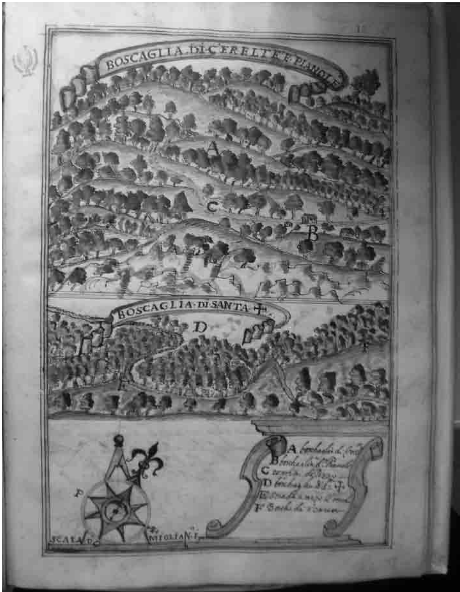
Figura 2. Le boscaglie di Cerrelte e Pianore (S. Maria a Monte) e di Orentano (S. Croce) (c. 17r)